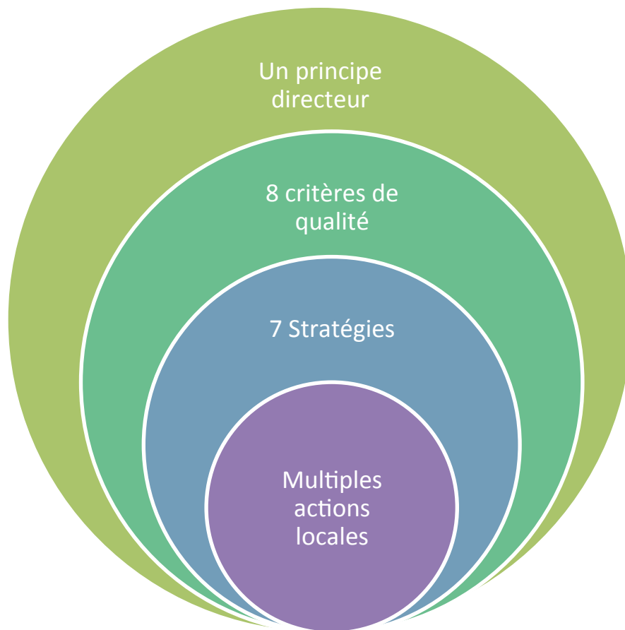
Illustration des composantes du présent document intitulé Guide de stratégies et de pistes d'action en accueil et accompagnement du parent.

Pour illustrer les interventions en accueil et accompagnement du parent sur le terrain, le document comprend aussi des stratégies et des actions locales tirées des plans d'action des membres provinciaux et territoriaux de la CNPF. Ces actions locales sont susceptibles d'appuyer les organismes ou les particuliers à répondre aux critères de qualité. Il est important de se rappeler que ni les actions locales, ni les critères de qualité, ne sont exhaustifs. Ils sont présentés uniquement à titre de suggestions.