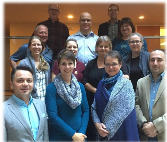
Membres du C.A. 2016-2017 de la CNPF